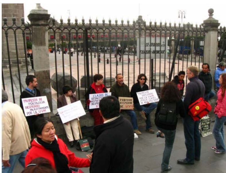
Acto de protesta del 27 de octubre a un costado de la Catedral Metropolitana